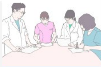
病棟・認知症ケアラウンド