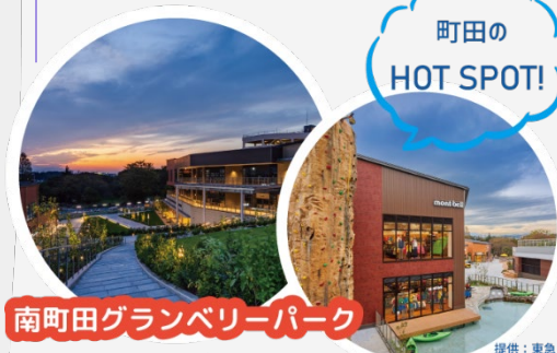
南町田グランベリーパーク

約22ヘクタールの敷地に ファッションや雑貨などの計241店舗のほか ピクニックやスポーツなどを楽しめる公園も あります